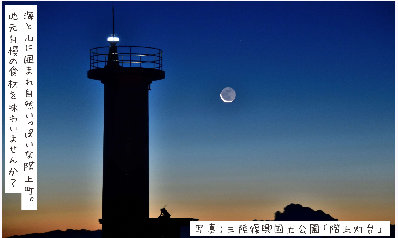
写真：三陸復興国立公園「階上灯台」